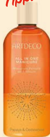
Intensiv pflegendes Himalaya- und Meersalz Peeling